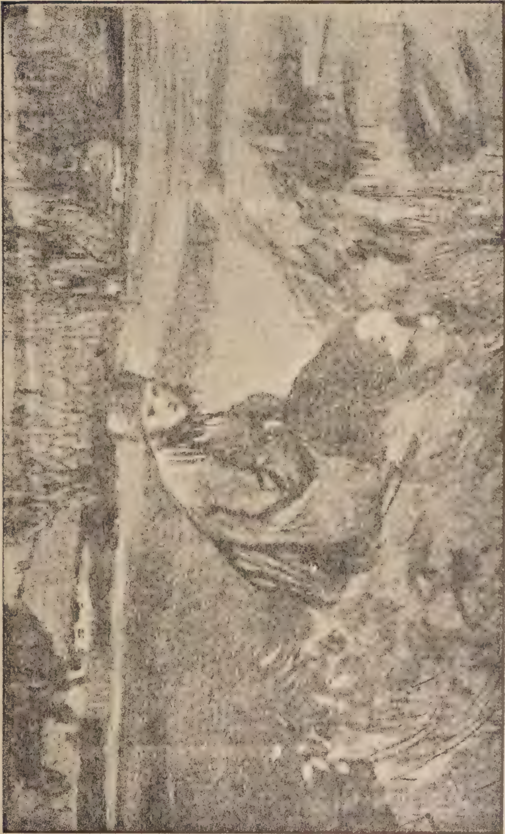
Сидить собі та дивить ся...